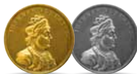
Jan Olbracht (1492-1501)